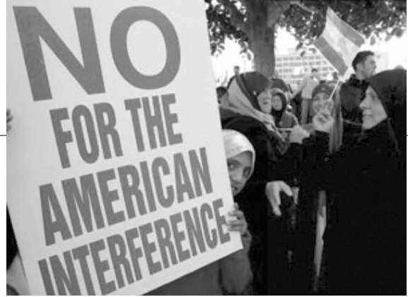
تمثّل الانقسام المذهبي العميق في أضخم تظاهرات في ٨ و ١٤ آذار، على الرغم مما حيك من أساطير كاذبة حاول طابع الثانية التوحيدي

أ - تعاضم موقع البرجوازية المصرفية، ورأس المال المالي، عموماً، حيال الشرائح الأخرى من البرجوازية المحلية، كما حيال المجتمع ككل، بحيث انعكس هذا الواقع بعمق على وضع القطاعات الإنتاجية، وبخاصة الصناعة والزراعة، فتراجعت تراجعاً واضحاً، سواء في وزنها الإجمالي على مستوى الاقتصاد والدخل القومي، أو في الدور السياسي للكتلة الاجتماعية التي تتخذها مصدراً أساسياً لمعيشتها.