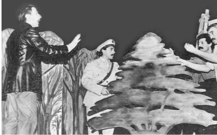
مشهد من شي فاشل.

هذا الاتصال بالحاضر لهو من الأمور المهمة التي تميّز مشروع زياد من مشروع أهله. فإذا كان المسرح على يد زياد قد تحوّل إلى رواية، فإنّ عمل الأخوين رحباني بعكس ذلك: فلقد حوّل المسرح إلى ملحمة. وما يسيّم الملحمة، بحسب باختين وغيره أمثال لوكاش، (٤) هو ابتعادها وانكتمها عن أيّ حاضر. وفي حين تنظر الملحمة إلى الورا، فإنّ الرواية والأجناس المحوكة إلى رواية متجدّرة في الحاضر، بل تنظر دائماً